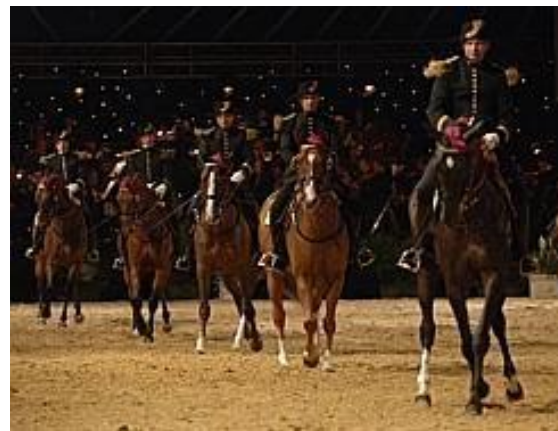
Cadre noir de Saumur (F)

Auf dem Programm stand noch das Seitwärtsverschieben bzw. Schulter herein, das wir mit unseren Endurance-Pferden zu einem physiotherapeutischen Zweck verwenden – also nicht die hohe Dressurschule, aber die Schultern sollten lockerer werden. Nach Pflicht folgte Kür und jeder hatte noch Zeit und Möglichkeit frei zu trainieren. Die einen galoppierten auf der Bahn, die anderen an der Broye.