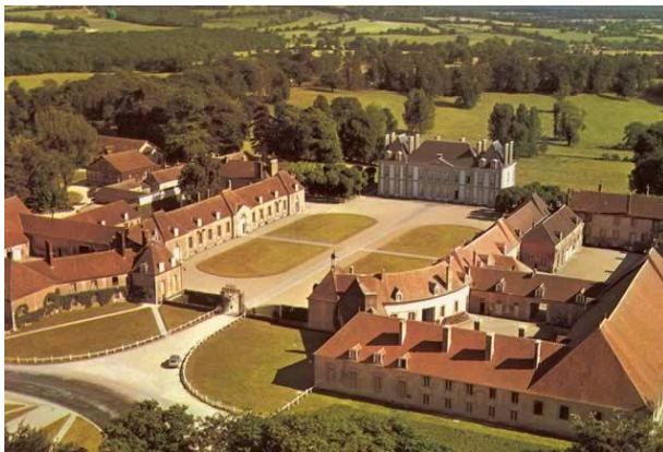
Start: Haras du Pin

Die WEG 2014 finden ja bekanntlich in der Normandie um dem Mont-Saint-Michel statt. Neu ist nun ein Rennen von A nach B geplant (wie Florac). Das Rennen soll beim Haras du Pin starten und bis zum Mont-Saint-Michel führen. Die Organisation des Rennens übernimmt das Team, das den CEI Argentan schon seit mehreren Jahren organisiert.